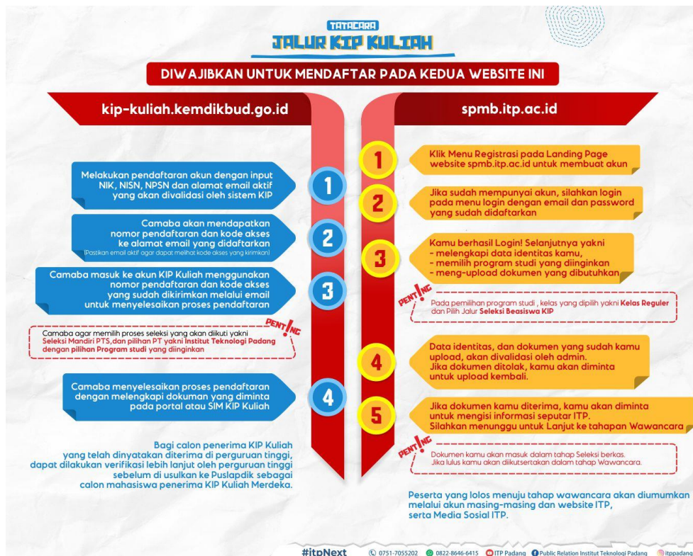
Gambar 1. Pendaftaran Beasiswa KIP-K